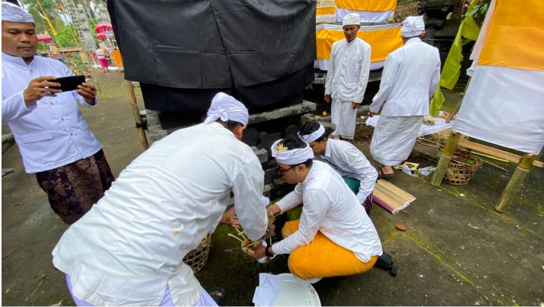
Selasa 14 Januari 2025, Melaksanakan Kegiatan Mengadiri Undangan, Upesaksi Dan Mendem Pedagingan Di Pura Dalem Desa Adat Mijil