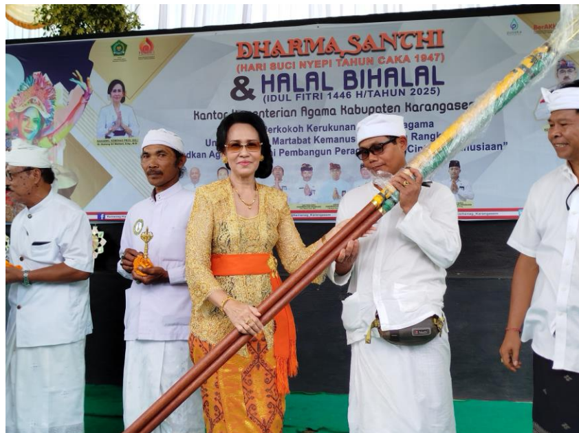
Potho 2. Penyerahan bantuan kepada pengurus Pengurus Pura Puseh Geriana Kauh.