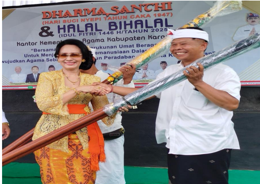
Potho 1. Penyerahan bantuan kepada pengurus Pengurus Pura Dalem Tanah Ampo